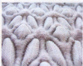
アレキサンドラ・ガカ氏がデザイン したハイブリッド・アンド・フュー ジョンのテキスタイル