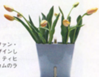
ディック・ファン・ ホフ氏がデザインし たロイヤル・ティヒ ラー・マッカムのラ ンプと花瓶

発表されたこのバッグは2006年にニュー ーヨーク近代美術館の永久コレクション に加わった。